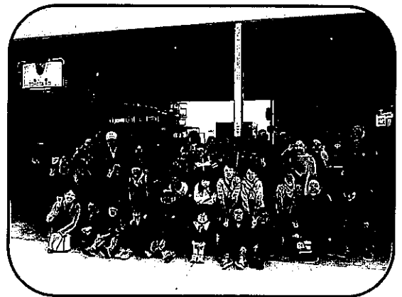
【防災対策事業】 防災・交通安全体験学習（豊田市）