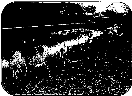
【クリーン・グリーン事業】 稗田川草刈り