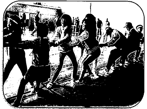
【運動会事業】 青木町・春日町・沢渡町・稗田町 対抗運動会